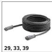
29, 33, 39