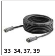
33-34, 37, 39