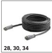
28, 30, 34