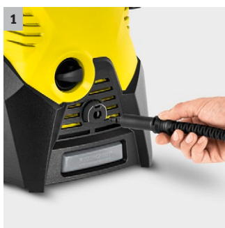
1 Quick Connect