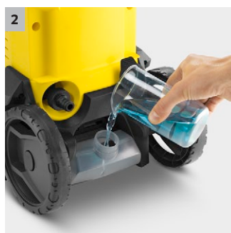
2 Čistě řešení díky nádrže