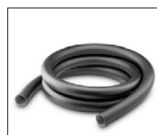
50, 53, 56