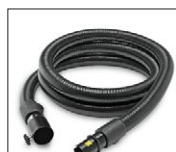
48-49, 52, 54-55