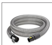
39-40, 42-43, 45-46