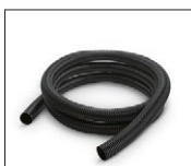
29, 32, 35