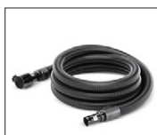
27-28, 30-31, 33-34