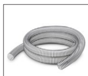
41, 44, 47