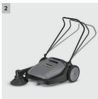
2 Nastavitelné držadlo