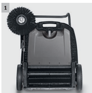
1 Pohon hlavního zameťacího válce