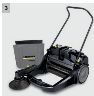
3 Velká nádoba na nečistoty