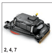
2, 4, 7