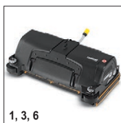
1, 3, 6